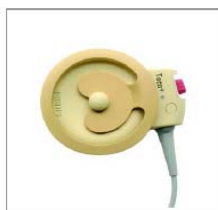
9898031 43401 včetně TOCO+ sondy